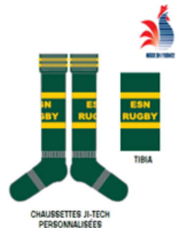
CHAUSSETTES JI-TECH PERSONNALISÉES

ENSEMBLE ENFANT (Maillot short + chaussettes)